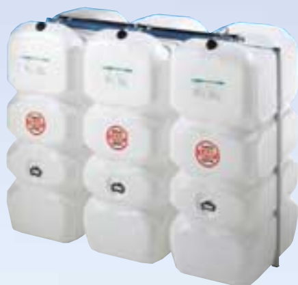
Sestava jednoplášťových nádrží (příklad)